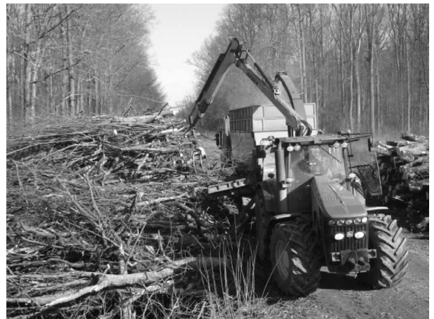
Slika 6. Iveranje energijskoga drva Fig. 6 Chipping of energy wood