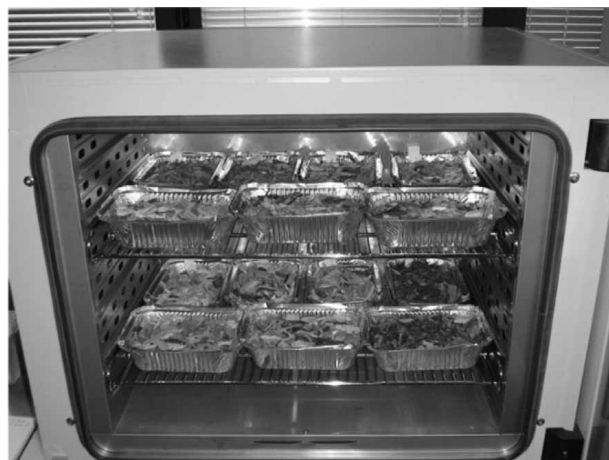
Slika 4. Sušenje uzoraka drvnoga iverja

Tijekom 2009. godine provedeno je istraživanje prirodnoga prosušivanja energijskoga drva hrasta i jasena. Terenski je dio istraživanja proveden u sklopu projekta »Mehanizirana uspostava šumskoga reda«, koji je financiralo trgovačko društvo Hrvatske šume d.o.o. Na području UŠP Vinkovci u gospodarskoj jedinici »Slavir« energijsko je drvo nakon oplodne sječe početkom 2009. godine izvezeno forvardrom i uhrpano na pomoćnom stovarištu (slika 5). U tri je navrata tijekom 2009. godine drvo sa složaja iverano (slika 6) i pri tom je obavljeno uzorkovanje. Uzorci su drvnoga iverja laboratorijski obrađeni u Laboratoriju za šumsku biomasu Šumarskoga fakulteta u Zagrebu, sukladno normi EN 14774–2:2009