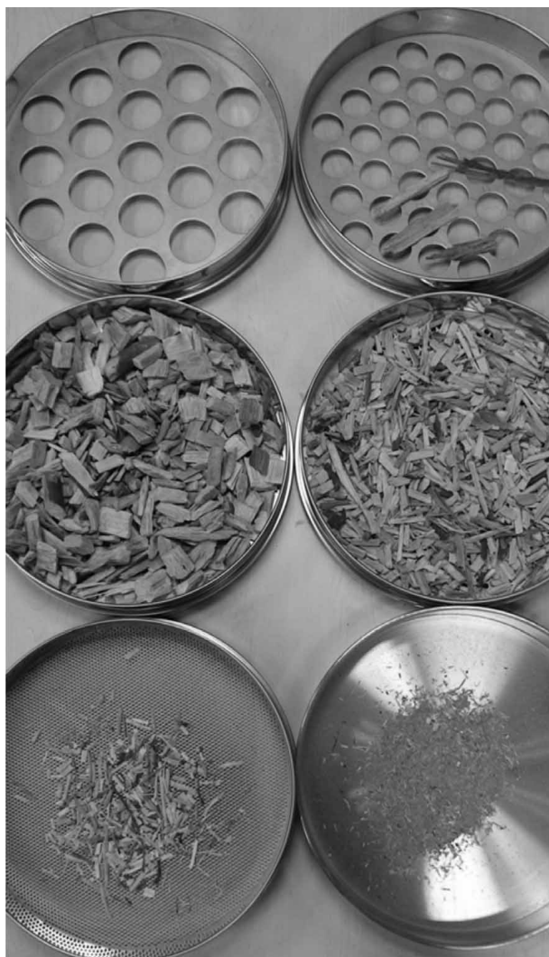
Slika 2. Frakcije drvnoga iverja Fig. 2 Wood chips fractions

Sadržaj vode/vlage u drvu može se izraziti masenim udjelom (postotnim odnosom mase vode sadržane u drvu prema masi samoga drva) i volumnim udjelom (postotnim odnosom volumena vode sadržane u drvu prema ukupnom volumenu drva). Maseni se udio vode u drvu može iskazati standardnim i tehničkim postotkom sadržaja vode. Standardni je maseni udio vode u drvu ( u_s ) postotni odnos mase vode sadržane u drvu prema masi drva u