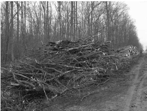
Slika 5. Složaj energijskoga drva Fig. 5 Energy wood stack