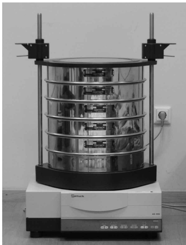
Slika 1. Oscilator Fig. 1 Oscilating device

Najmanje osam litara prosušenoga uzorka drvnoga iverja udjela vlage ispod 20 %, poznate mase, prosijava se kroz niz sita promjera oka 3,15 mm, 8 mm, 16 mm, 45 mm i 63 mm. Analiza se može obaviti ručno ili oscilatorom, uređajem koji u horizontalnoj ravnini primjerenom frekvencijom i u primjerenom vremenu obavlja prosijavanje (slika 1). Rezultat je analize udio pojedine frakcije drvnoga iverja (slika 2) u ukupnoj masi uzorka.